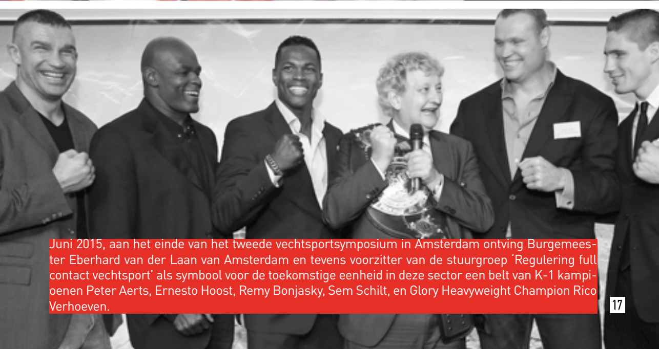
Juni 2015, aan het einde van het tweede vechtsportsymposium in Amsterdam ontving Burgemeester Eberhard van der Laan van Amsterdam en tevens voorzitter van de stuurgroep 'Regulering full contact vechtsport' als symbool voor de toekomstige eenheid in deze sector een belt van K-1 kampioenen Peter Aerts, Ernesto Hoost, Remy Bonjasky, Sem Schilt, en Glory Heavyweight Champion Rico Verhoeven.